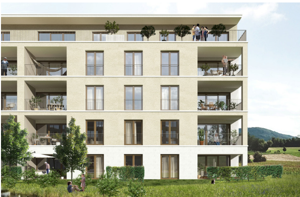
Unsere aktuellen Neubauprojekte in Untersiggenthal und Stein am Rhein.