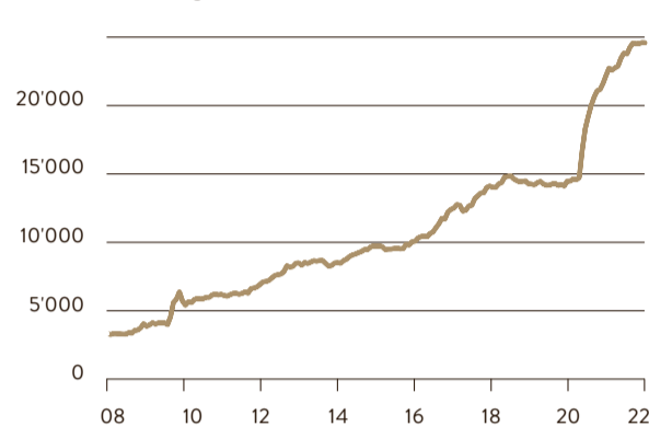
Bilanz der wichtigsten Notenbanken Fed, EZB, BoJ, in USD Mrd.

tatenlos zu. Mittlerweile haben sich diese Ansichten aber geändert, und die Zentralbanken haben die strukturellen Komponenten erkannt. Unternehmen konzentrierten sich in den letzten Jahren auf die Kostenreduktion, produzierten in Niedriglohnländern und hielten die Lagerhaltung möglichst knapp. Diese Tendenzen dürften sich aufgrund der gesammelten Erfahrungen während der Corona-Krise umkehren und zu höheren Produktions- und Vertriebskosten führen. Zudem ist zu erwarten, dass in den kommenden Jahren die Ausgaben im Zusammenhang mit der Dekarbonisierung von Unternehmen steigen werden. Ausserdem ist der Arbeitsmarkt – speziell in den USA – aufgrund der Corona-Pandemie sowie der zunehmenden Bevölkerungsalterung ausgetrocknet, wodurch die Löhne längerfristig steigen dürften. Dass die Energiepreise angesichts der gegenwärtigen geopolitischen Konflikte weiter steigen werden, ist zudem ebenfalls wahrscheinlich. Die genannten Faktoren dürften sich in einem längerfristig steigenden Preisniveau ausdrücken, welches zu negativen Realzinsen führt. Mit Blick auf die Staatsverschuldung ist die gestiegene Inflation für verschuldete Regierungen wünschenswert, da sich die Staatsschulden ohne schmerzhafteste Steuererhöhungen abtragen lassen. Die-